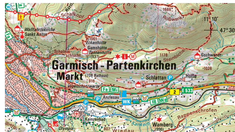
Ausschnitt aus der UK50-51 Karwendel

Die Partnachklamm gehört zu den Höhepunkten rund um Garmisch-Partenkirchen. Deutschlands höchst gelegenes Museum in einem Riesenfernrohr an der Bergstation der Karwendelbahn informiert über das alpine Ökosystem. Entspannung oder Spaß für die Kleinen gibt's in einem der Erlebnisbäder der Region wie dem Alpspitz-Wellenbad in Garmisch-Partenkirchen oder der Isarwelle in Lenggries. Unvergessliche Blicke auf die Alpen genießt man bei einer Schifffahrt auf dem Achensee.